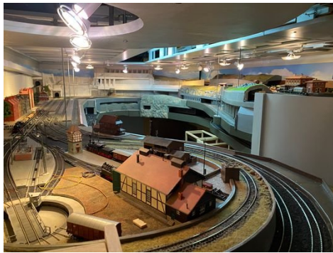
grosser Kellerraum mit Super Eisenbahnanlage