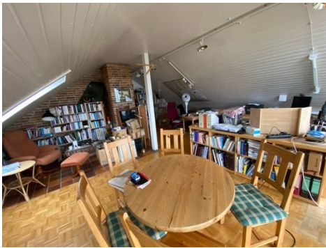
grosses Zimmer, mit grosser Giebel-Glasfront