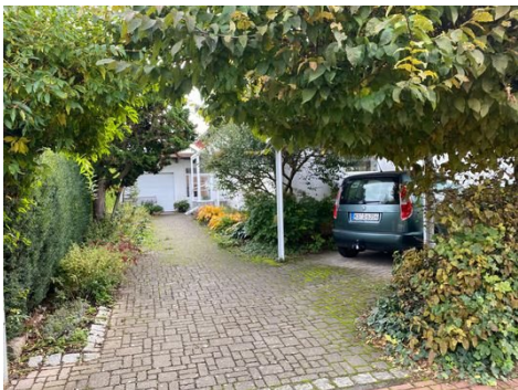
Einfahrt zur Garage und zum Carport