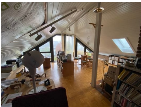
grosses Zimmer DG